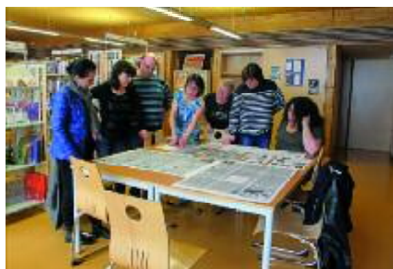
La préparation de l'évènement

bibliotheque-municipale@audun-le-tiche.fr