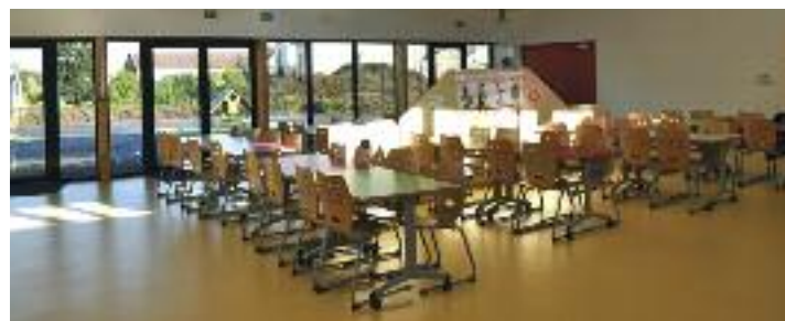
La salle de restauration

Plus d'infos sur le site de la mjc : www.mjcaudun.com ou au 03 82 59 65 00