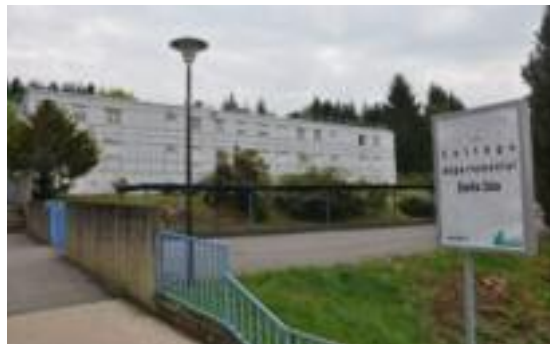
Collège Emile Zola - 380 élèves

Pour sa première prise de fonction au collège audunois, la rentrée a été une réussite.