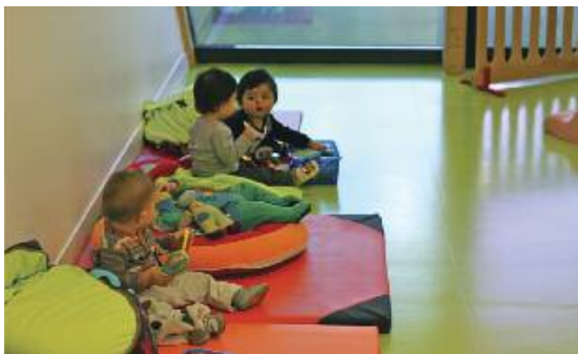
Au coeur de "L'île aux trésors"

Un dossier administratif sera à constituer à l'admission de l'enfant. La tarification horaire s'applique selon le mode de calcul communiqué par la CAF en fonction des ressources de la famille et du nombre d'enfants. La facturation s'effectue mensuellement.